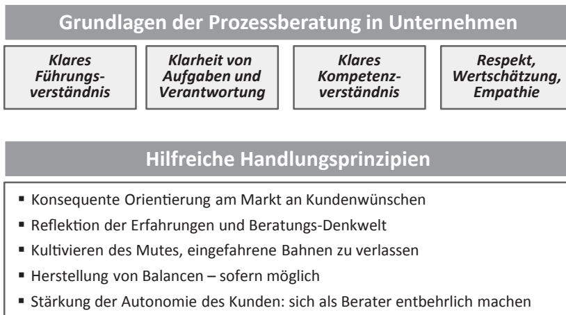
Abb. 2: Grundlagen der Prozessberatung und Handlungsprinzipien

Besonders der letzte Punkt sorgt manchmal für Irritation, weil er aus betriebswirtschaftlicher Sicht unsinnig erscheint oder zumindest altruistisch anmutet. Doch genauer betrachtet, spiegelt sich darin die Absicht wieder, Kompetenzen unserer Kunden zu fördern, also sicheres Handeln in unsicheren Situationen zu ermöglichen. Zusätzlich liegt darin auch eine sehr nachhaltige Form der Kundenbindung, die sich langfristig auszahlt. Uns ist es wichtig, für eigenverantwortliches Handeln mit nachhaltiger Wirkung zu sorgen, und das mit möglichst geringem Ressourceneinsatz.