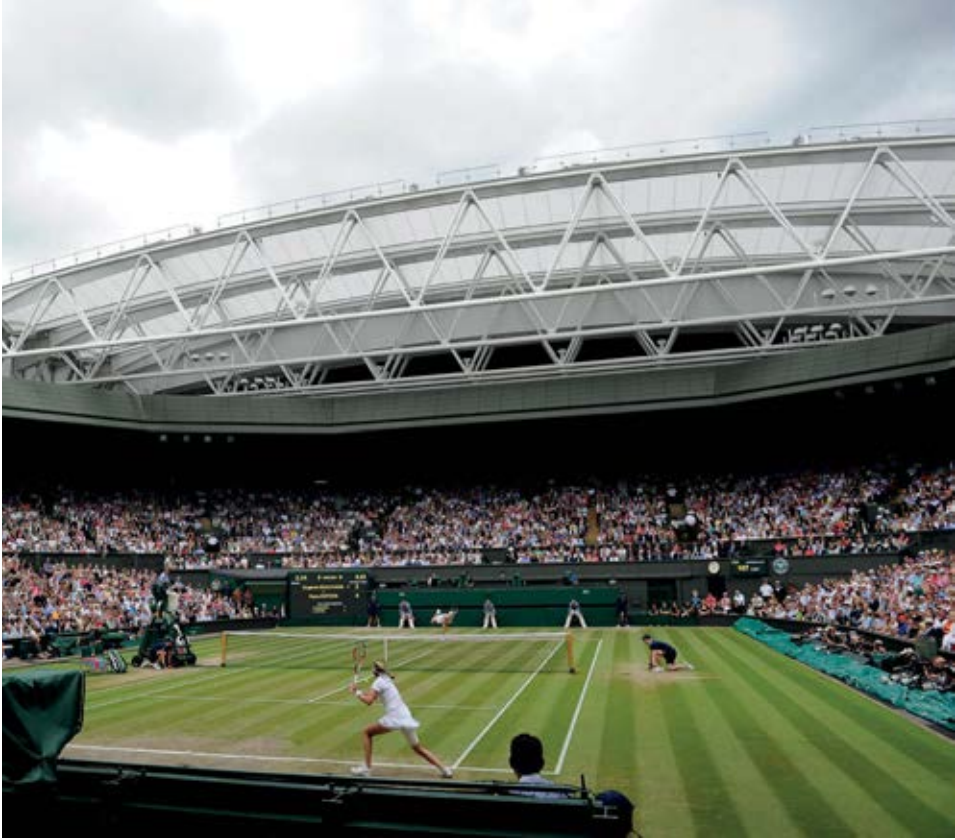
Der Traum jedes Tennisspielers: Der Centre Court in Wimbledon