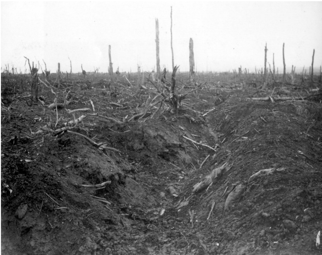
Schlachtfelder des Ersten Weltkrieges (September 1916)