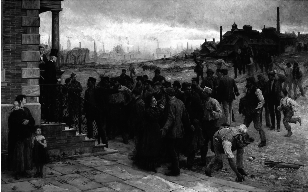
Robert Koehler: Der Streik (1886)