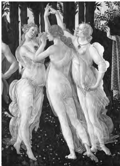
4 Die drei Grazien: Sandro Botticelli (Ausschnitt aus dem Gemälde »La Primavera«; um 1478).

nördlich der Alpen verhaftet. Die erste Reise nach Italien hatte er zu Beginn einer Pestepidemie in Nürnberg 1498 unternommen, die zweite 1504. Abbildung 5 zeigt ein Werk Dürers, das nach seiner ersten Reise entstand. Dargestellt ist die Geburt Christi, zwar bereits perspektivisch mit (etwas übertriebener) Tiefenflucht, aber doch noch teilweise der mittelalterlichen Maltradition verhaftet. Die Krippenszene ist in die Kulisse einer romanischen Ruine hineingesetzt, also ahistorisch, und die Nebenfiguren im Vordergrund am rechten und am linken Bildrand, darunter auch die Vertreter der Familie der Stifter des Altars, sind viel kleiner dargestellt als die Hauptper-