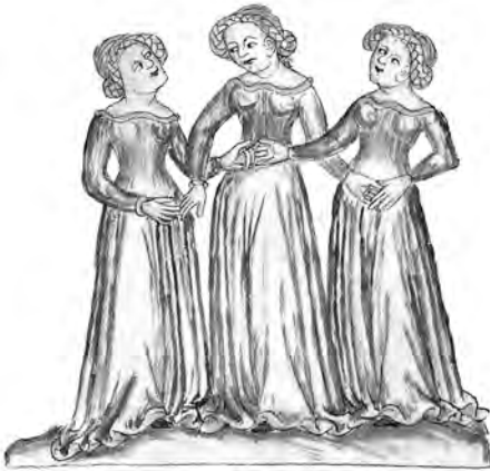
3 Die drei Grazien: Buchillustration aus dem frühen 15. Jahrhundert.

und Frauen in Auftragsarbeiten porträtiert, wobei die Maler, um die gewünschte Bedeutung und Individualität ihrer Auftraggeber deutlich zu machen, nicht nur deren Schönheit, sondern vor allem auch deren Reichtum durch Hervorhebung von Kleidung und Schmuck glänzen ließen. Vorbei war die Bescheidenheit des Mittelalters, als sich die Auftraggeber eines Gemäldes höchstens als eine der Nebenpersonen einer religiösen Szene darstellen lassen konnten.