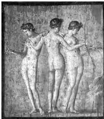
2 Die drei Grazien: römisches Fresko (1. Jahrhundert n. Chr.).

in unbekleideter Schönheit des Körpers und dreidimensional (Abb. 2).