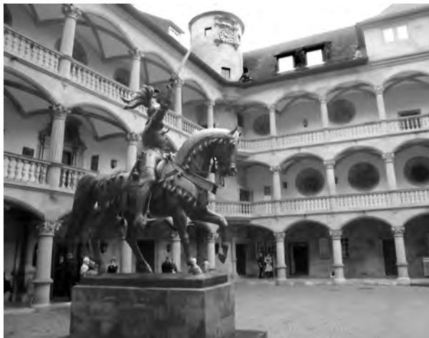
6 Die Arkaden des Alten Schlosses in Stuttgart.

an der flachen Ausprägung der Bogen und des Gewölbes. Die Arkaden sind eines der frühesten süddeutschen Beispiele einer solchen Hofanlage der Renaissance.