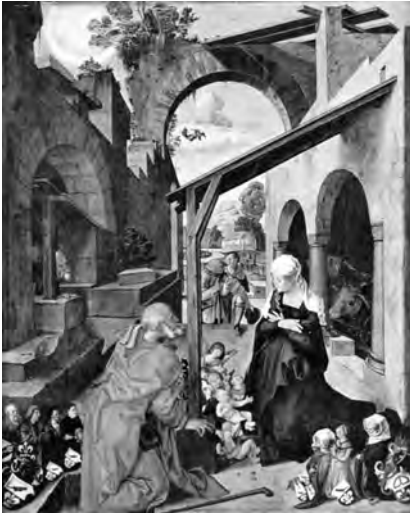
5 Albrecht Dürer: Der Paumgartner- sche Altar (um 1503).

sonen, eben entsprechend ihrer geringeren religiösen Bedeutung. Ihre Darstellung gehorcht also noch der mittelalterlichen Ikonographie.